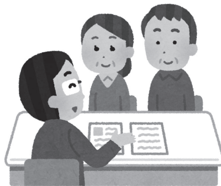
納得いくまで相談しよう!